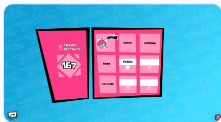
Colocar pistas en el tablero