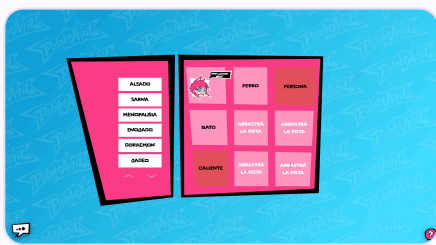
Escribir pistas para cada palabra