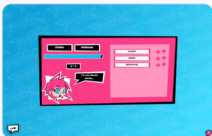
Votación de las mejores pistas